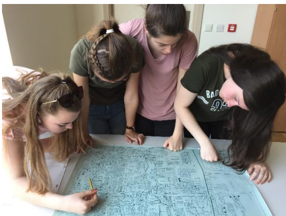
Medieval Canterbury Workshop