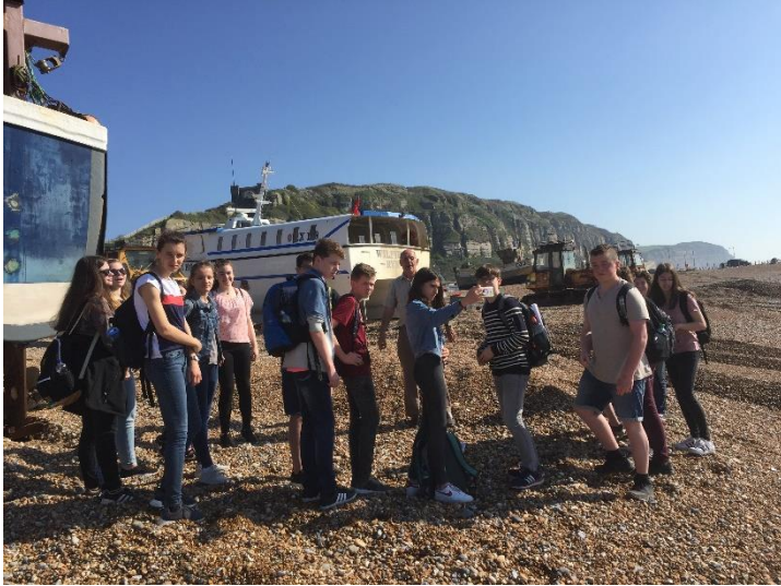
Guided Tour in Hastings