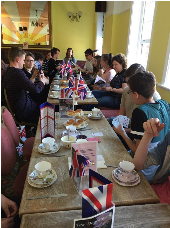
Tea and Department in Hastings